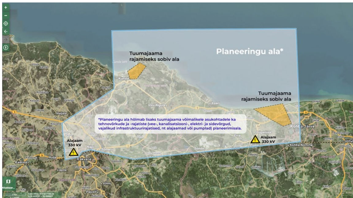
Joonis 1. Planeeringuala ettepanek koos võimalike tuumajaama asukohtadega

REP-i asukoha eelvaliku tegemisel tuleb arvestada võimalusega, et protsessi käigus võidakse teha põhjendatud ettepanek täiendavate asukoha alternatiivide kaalumiseks.